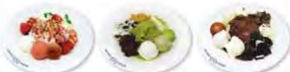
딸기 젤라또 빙수

NEW 젤라또 빙수 ..... 13,000 Gelato Snowflake Sherbet < 딸기 / 녹차 / 초코 >