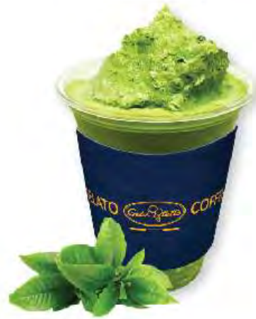
녹차 젤라치노 Green Tea Gelaccino