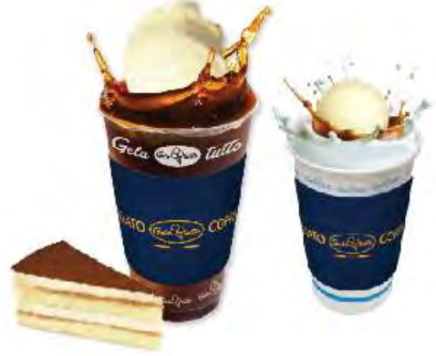
티라미수 카페 플러트