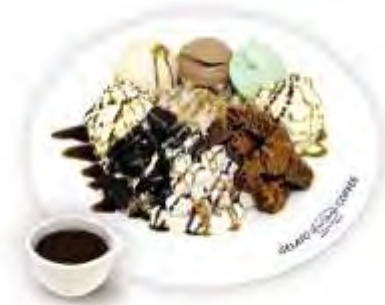
초코 누텔라 젤라또 빙수