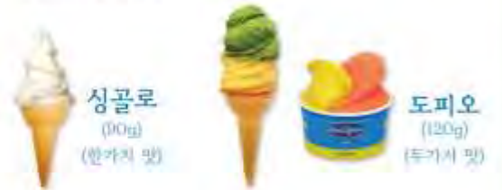
싱글로 (10g) (한가지 맛)