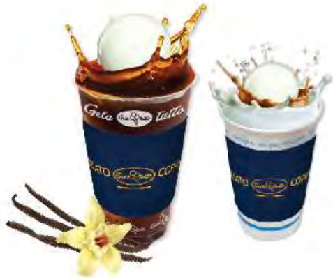
바닐라 카페 플러트