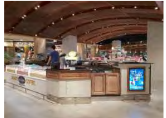
- 신세계 하남 스타필드점