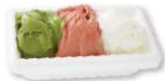
M 메디아 (세가지 맛) 17,000원