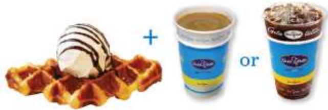
크로와상 와플 젤라또 커피세트