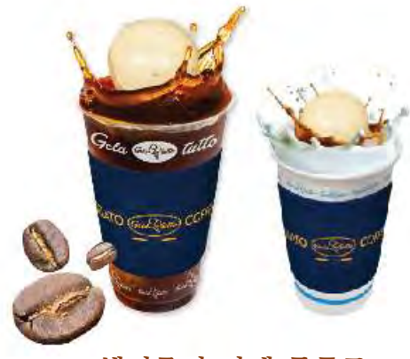
헤이즐넛 카페 플러트