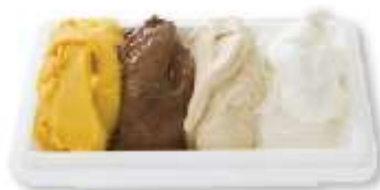
L 그란데 (네가지 맛) 23,000원