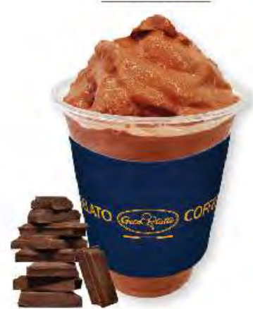
초콜릿 젤라치노 Chocolate Gelaccino