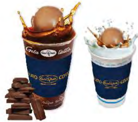
초콜릿 카페 플러트