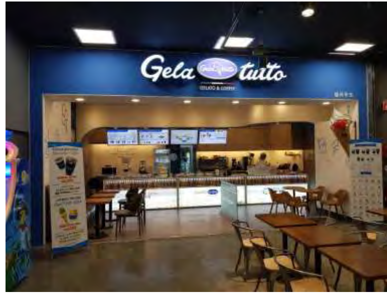
- 홈플러스 서부산점