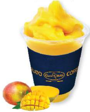
망고 젤라치노 Mango Gelaccino