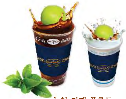
녹차 카페 플러트