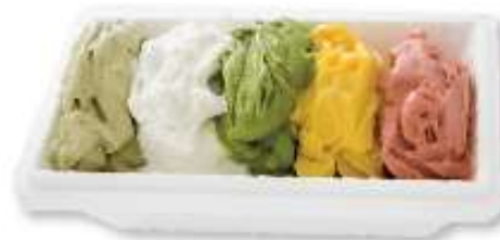
XL 파밀리아 (다가지 맛) 28,000원