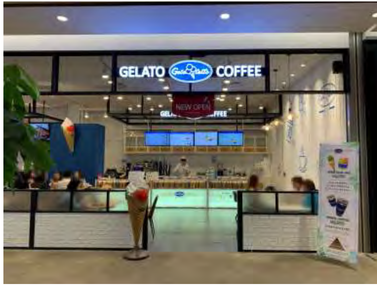
- 롯데몰 은평점