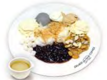
인절미 젤라또 빙수