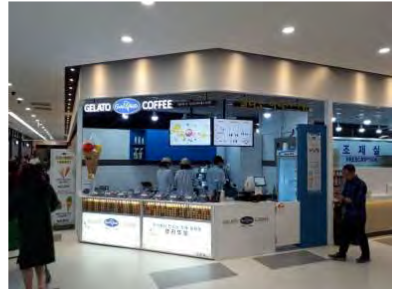
- 양산 라피에스타점