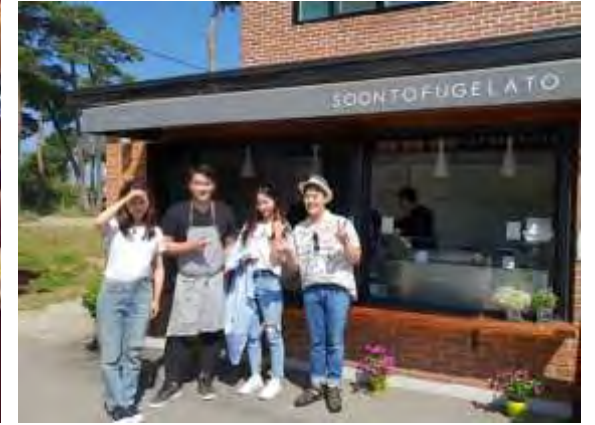
강릉 순두부 젤라토