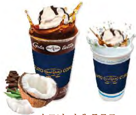
초코넛 카페 플러트