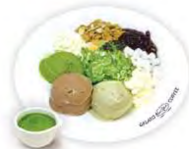
녹차 젤라또 빙수