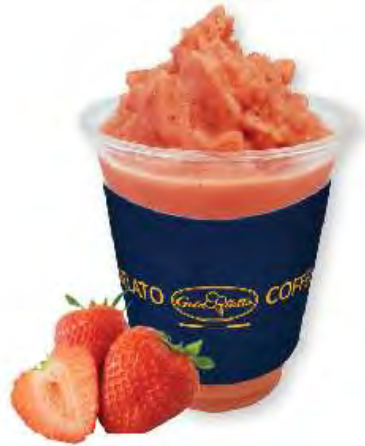
딸기 젤라치노 Strawberry Gelaccino