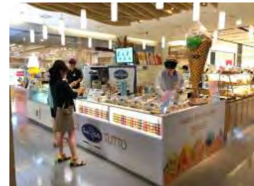
콘 쇼케이스 적용 매장